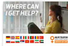
Klappflyer (Format Cover: 115 x 75 mm) Deutsch, Englisch, Spanisch, Französisch, Italienisch, Portugiesisch, Rumänisch, Türkisch, Russisch, Polnisch, Bulgarisch, Serbisch, Vietnamesisch, Chinesisch, Persisch/Farsi, Arabisch Art-Nr: 4FL164