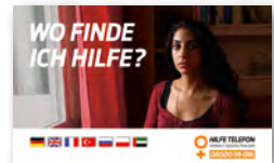
Notfallklappkarte (Scheckkartenformat) Deutsch, Englisch, Französisch, Türkisch, Russisch, Polnisch, Arabisch Art-Nr: 4SO165