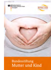
Flyer (DIN A5) in fünf Sprachen bestellbar