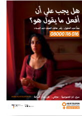
Plakat (DIN A4) Arabisch Art-Nr: 4SO169