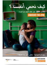
Plakat (DIN A4) Arabisch Art-Nr: 4SO168