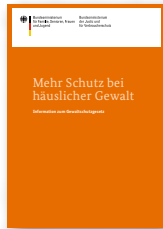
Broschüre (DIN A4) Deutsch Art-Nr: 4BR51

Extra-Elternbrief: Kinder leiden mit – Rat und Hilfe bei häuslicher Gewalt