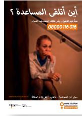
Plakat (DIN A4) Arabisch Art-Nr: 4SO167