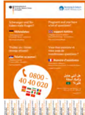
Abreißplakat (DIN A4) Deutsch, Englisch, Französisch, Arabisch, Serbisch Art-Nr: 4SO171