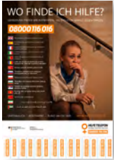
Abreißzettel (DIN B4) Deutsch, Englisch, Spanisch, Französisch, Italienisch, Portugiesisch, Rumänisch, Türkisch, Russisch, Polnisch, Bulgarisch, Serbisch, Vietnamesisch, Chinesisch, Persisch/Farsi, Arabisch Art-Nr: 4SO163